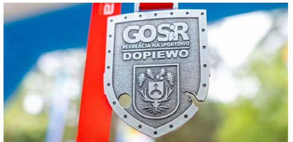
Jak zawsze na uczestników zawodów czekają pamiątkowe medale i upominki od organizatorów (Zdjęcie nadesłane)

Opracował: Mariusz Frąckowiak – GOSiR w Dopiewie