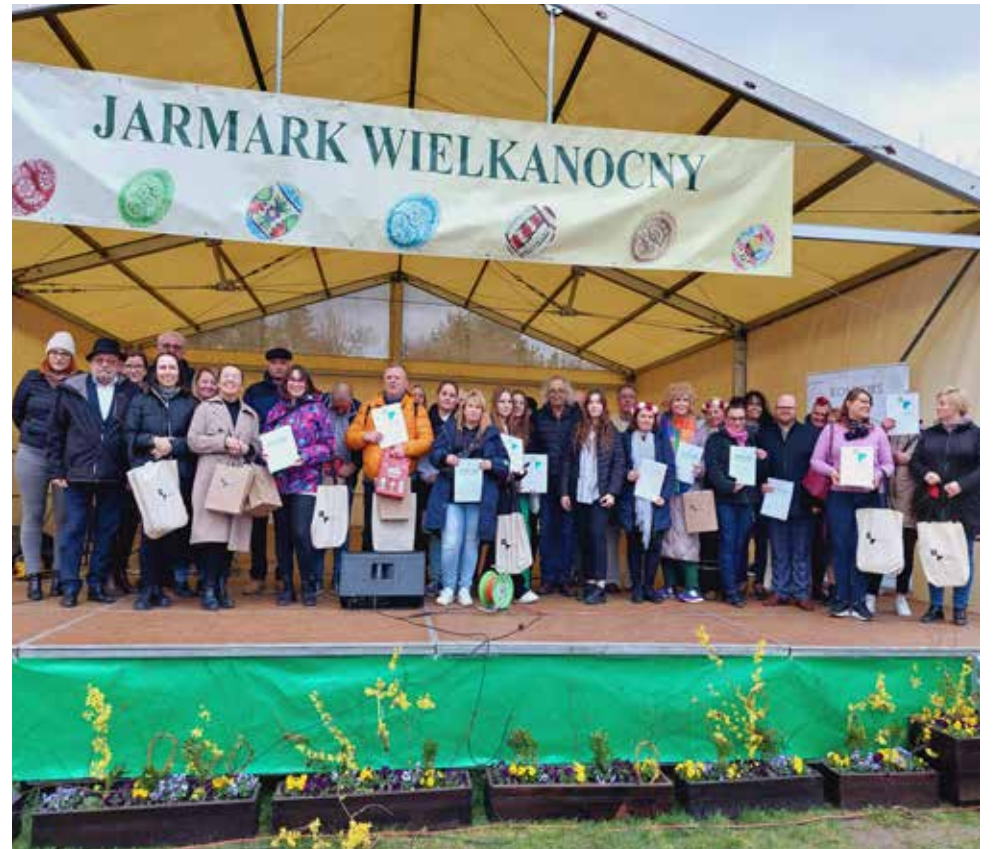
Wspólne zdjęcie laureatów Jarmarku Wielkanocnego.