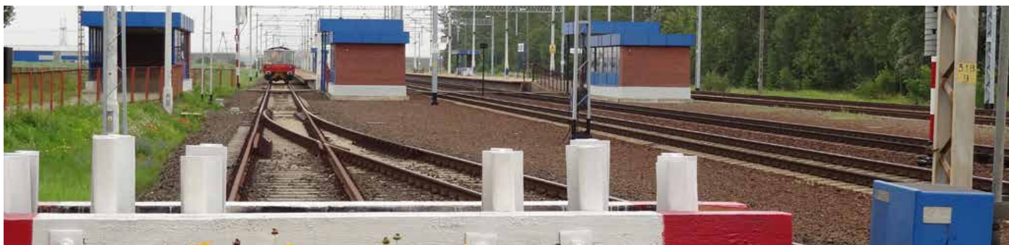
Kolejne dwa tory będą zbudowane na trasie Poznań - Nowy Tomysł.

Na podstawie: rynek-kolejowy.pl oraz źródeł własnych.